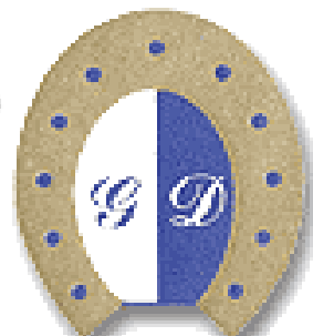
Club gentleman Campania