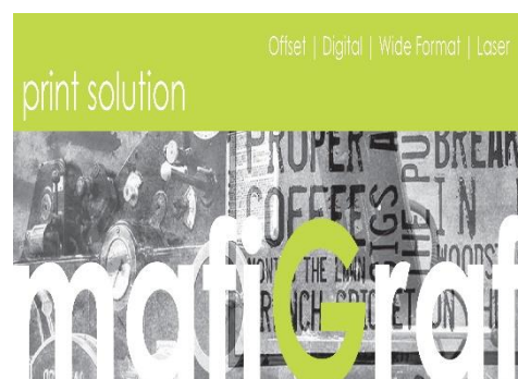
info@mafigraf.com - www.mafigraf.com - TEL. 0881636854 - 3703199438