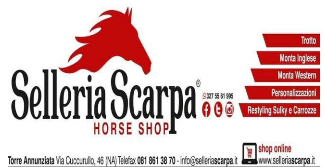
Torre Annunziata Via Cuccurullo, 46 (NA) Telex 081 861 38 70 - info@selleriascarpa.it shop online www.selleriascarpa.it